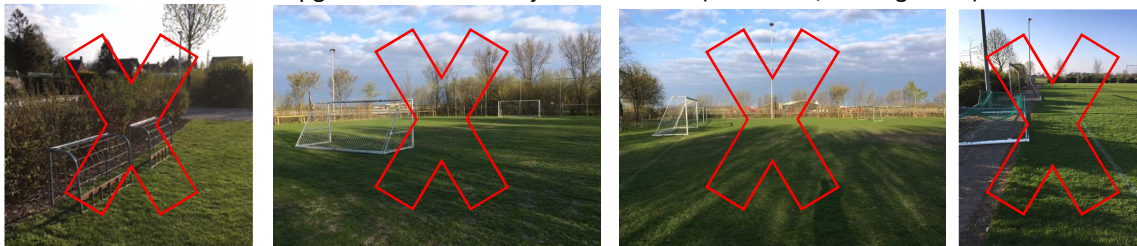
Doelen nog steeds op het veld/gras en niet op de juiste plaats

Natuurlijk snappen we dat het soms lastig is om een doel te verplaatsen met de allerjongste, maar als een doel door het hele team wordt opgetild is het een fluitje van een cent (teamwork/ team gevoel.)